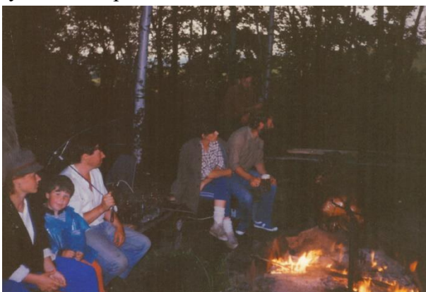
Schůzky mládeže v 70. a 80. letech „ve skále“