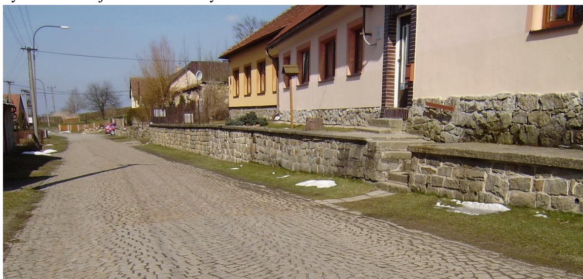
Dlažební kostky z jankovského lomu po více než 70 letech vytvářejí pevný povrch silnice středem vsi, domy při horní straně mají kamenné zídky.

V polovině 50. let dřevěná bouda i kovárna vyhořely. K požáru došlo v noci, kdy se zřejmě nějaký doutnající uhlík vznítíl a rozhořel se. To už se sbíhali sousedé a utvořili živý řetěz od sádky až ke skále a podávali si kbelíky s vodou, což už na uhašení nestačilo. Poté už byla obnovena jen budka kovárny.