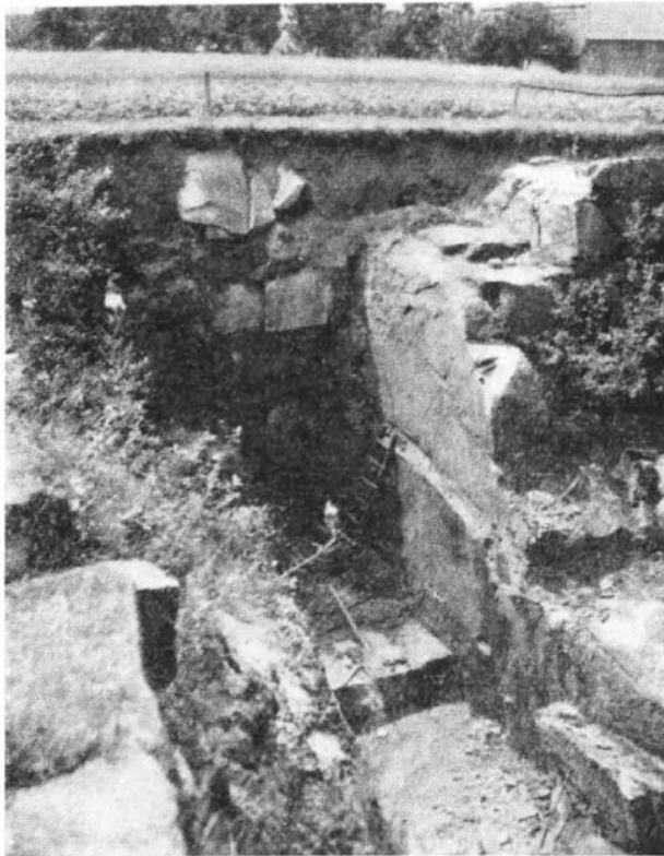
Pobled na lom u Jankova.

zaměstnání v různých lomech, v lese i na poli a trvalo to čtyři roky, než se mistr Křížek definitivně usadil v Jankově a začal těžit kvalitní žulu.