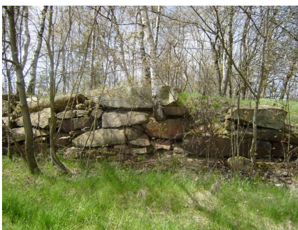
Současné pohledy na bývalý kamenolom, kde se dosud říká „Ve Skále“, ale málokdo už je pamětníkem těžby a zpracování žuly v oněch místech