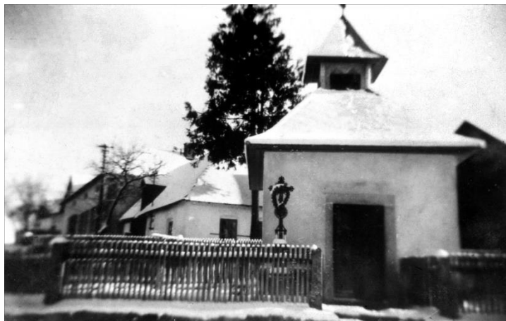
Foto kapličky z prvních let po dokončení, se zádkou a dřevěným plotem, v zahrádce byly záhony květin.