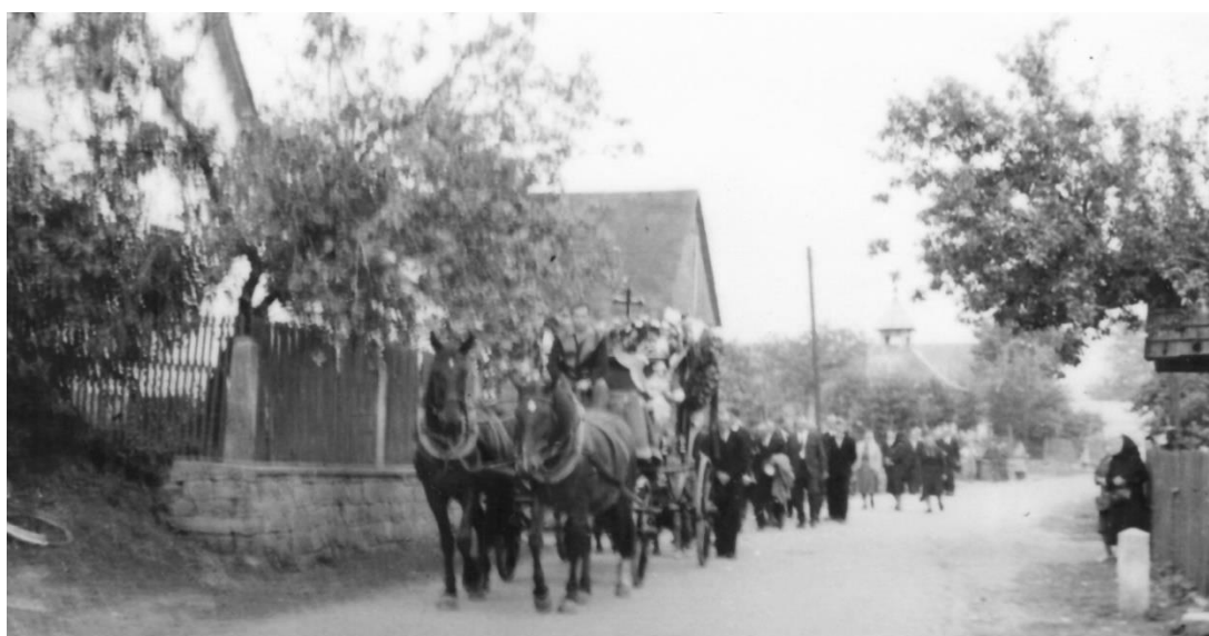
Pohřební průvody vyprovázely zemřelé sousedy z Jankova k uložení na vyskytenský hřbitov