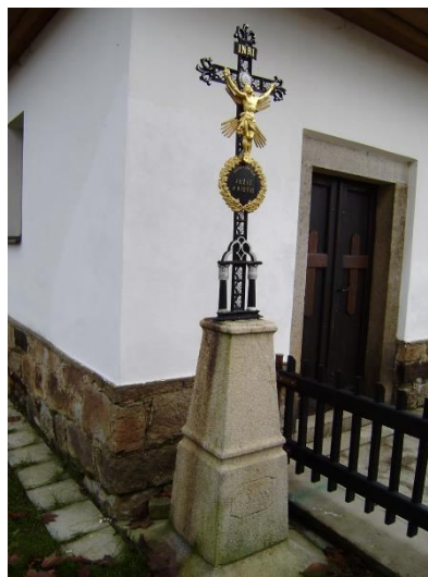
Oltární obraz sv. Anny s Pannou Marií a křížek před kapličkou