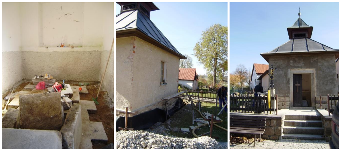
Vnitřní a vnější práce na opravě a odvodnění kapličky v r. 2021