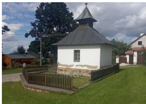
Foto kapličky z r. 2020 před rekonstrukcí

Po dalších 20 letech se ukázalo, že předchozí oprava nebyla udělána úplně dobře, protože vlhkost, která měla být odváděna z vnitřku kapličky, nefungovala, jak by měla, omítka uvnitř opět plesnivěla a odlupovala se. Navenek sice ještě kaplička vypadala pěkně, přesto bylo nutno udělat radikální nápravu, ke které došlo r. 2021. Nejprve byl vystěhován veškerý vnitřní mobiliář, poté se dalších oprav ujala stavební firma Josef Ladič. Stěny uvnitř kapličky byly otlučeny do výše 1 m, pro odvětrávání byla obnovena drenáž kolem kapličky i uvnitř podél zdí, instalace drenážních trubek a zašterkování, s tím souviselo také přeložení původní kamenné dlažby. Došlo k oškrabání starého štuku a k novému naštukování a natření fasádní barvou. Také byly opraveny měděné žaluzie ve věžičce, opraveny dveře a instalován nový plot. Na obnovu kapličky poskytl dotace Kraj Vysočina z fondu „Obnova venkova Vysočiny 2021“.