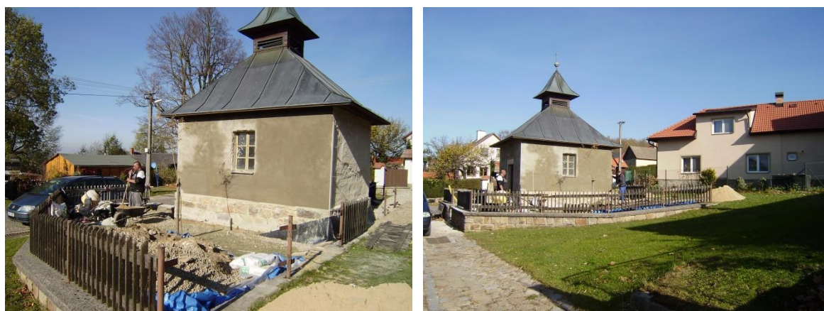
Natažení nové omítky a dokončovací práce v r. 2021