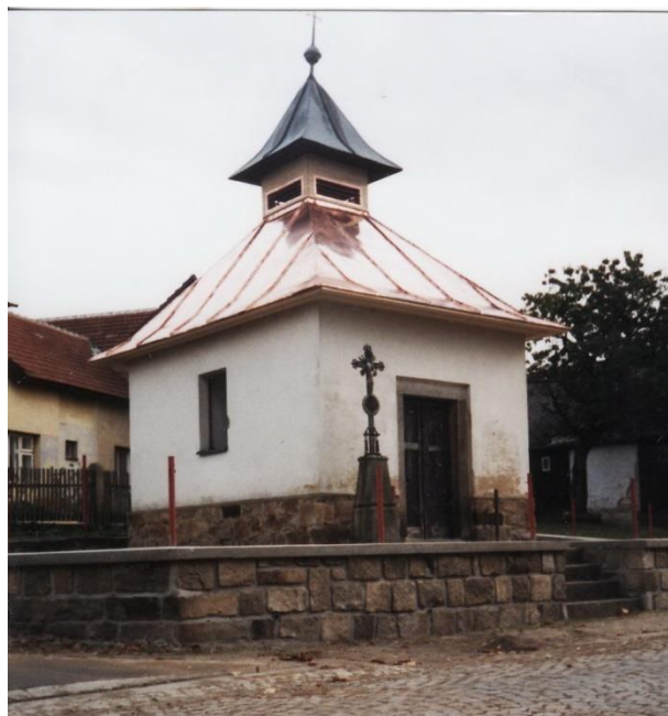
Pokrytí kapličky novou krytinou r. 2003