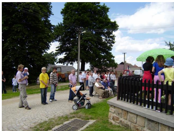
Fotografie z jankovských poutí