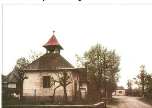
Fotografie kapličky s okolními hlohy, asi počátek 90. let