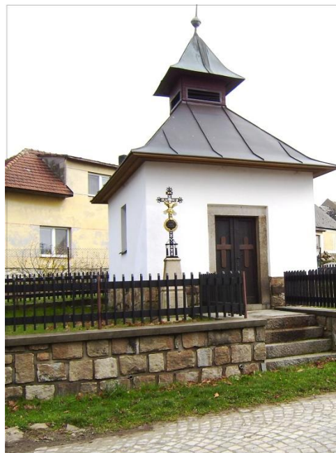
Kaplička zazářila opět v plné kráse