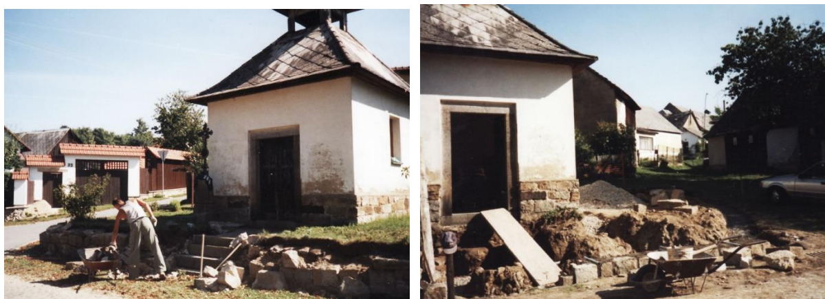
Práce na opravě kapličky v roce 2003