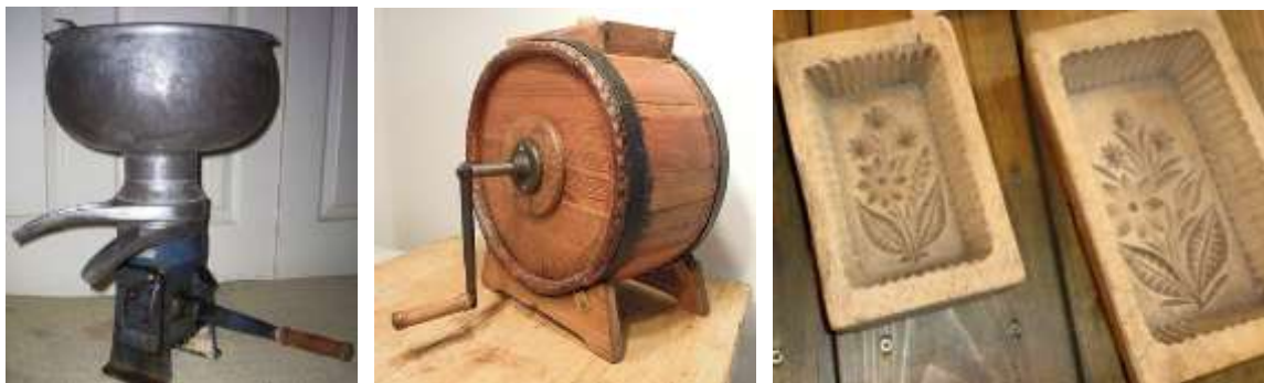
Odstředivka, bubnová máselnice a vyřezávané formy na máslo

Každá hospodyně musela umět podojit krávu. Při dojení seděla z boku krávy na stoličce a tahala mléko ze struků do dížky. Nadojené mléko pak přes plátýnko a síto přecedila do hrnců, kterým se někde říkalo krajáče. Ty se musely odnést do chladna, aby mléko nezкисло, u nás stejně jako ve většině zdejších chalup do chladného sklepa. Pamatuji si, že pouze ve dvou staveních byly haltýře , kterými protékala voda z pramenů. Bylo to „U Martinů“ a „U Křížů“, z jejich haltýřů pak protékala voda do rybníka.