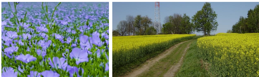
Lněné pole (ilustrační obrázek) a lány s řepkou olejnou u Jankova (foto 2009)

Každý rok pole na Vysočině rozkvétala modrými kvítky lnu, k nim se přidávaly bílé, modravé nebo fialkové květy máku a nakonec i podobně zbarvené květy brambor. Louky a meze rozkvétaly pestrobarevným voňavým kvítím. V současné době převažuje jediná žlutá barva řepky olejně.