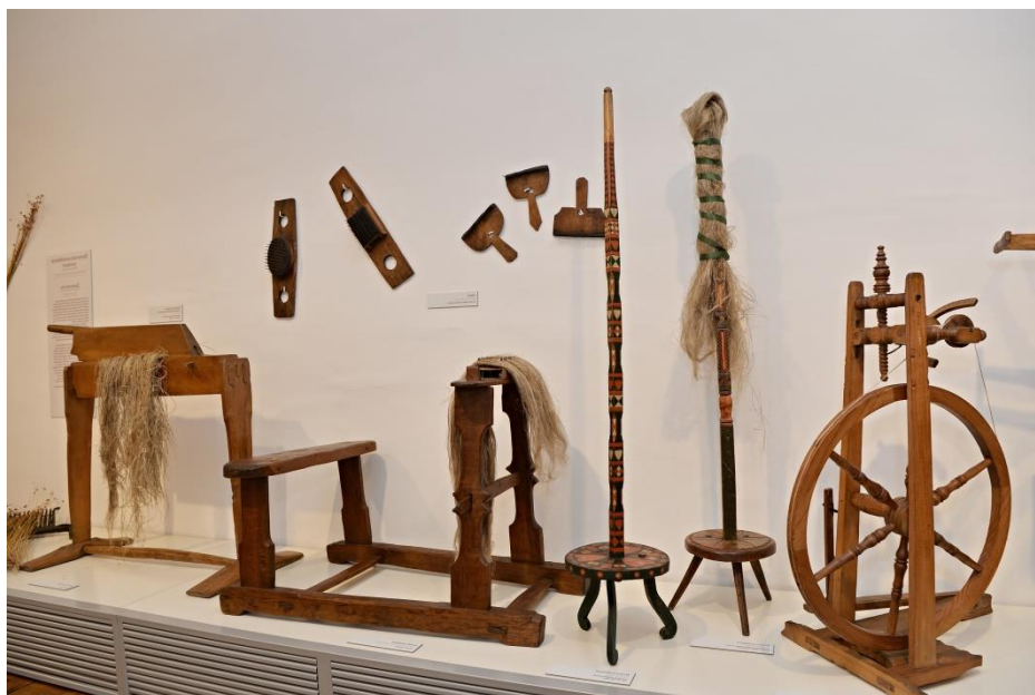
Nástroje na zpracování lnu – trdlice, vohlice, přeslice, kolovrátek a různé hřebeny na pročesávání vláken lnu

Po vytření na trdlici následovalo „ vochlování “, při kterém se vlákna čistila od zbytků dřevitých slupek a krátkých vláken. Vochlice byla dřevěná deska s kovovými (dříve i s dřevěnými) hroty, přes která žena lněná vlákna několikrát opakovaně pročesávala. Vyčesaná krátká vlákna se nazývala koudeľ , a i ta našla uplatnění v hospodářství. Dlouhá čistá rozvlákněná vlákna se urovnávala, promísila s dalšími vlákny a nasadila a uvázala na přeslici , odkud už přadleny u kolovrátku vlákna vytahovaly, stáčely a navíjely na cívku kolovrátku. Šlapáním uváděly kolovrátek do pohybu, stáčením a sliněním mezi prsty odvíjely silnější nebo tenčí nitě.