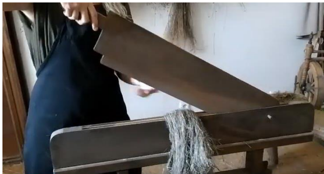
Kresba staré domácí trdlíce a ukázka lámání stonků na trdlici