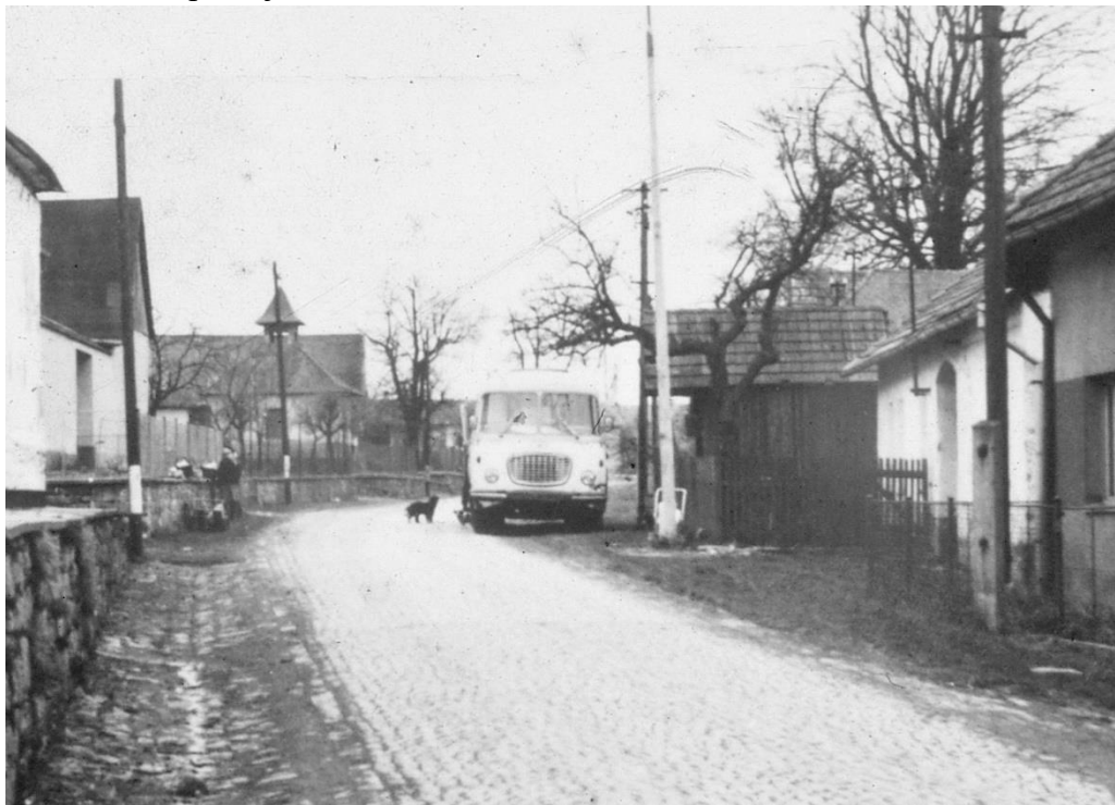
Nakupování u pojízdné prodejny v Jankově kolem r. 1980.

V 2. polovině minulého století začala do Jankova jezdit pojízdná prodejna , která vozila pečivo a základní sortiment potravin a drogerie. V průběhu let se tu vystřídalo několik různých prodejen z Pelhřimova a Humpolce. Pojízdná prodejna zajíždí se základním sortimentem do obce stále každou sobotu, ale většina rodin si dělá nákupy v supermarketech v Jihlavě nebo Pelhřimově, kde také pracují.