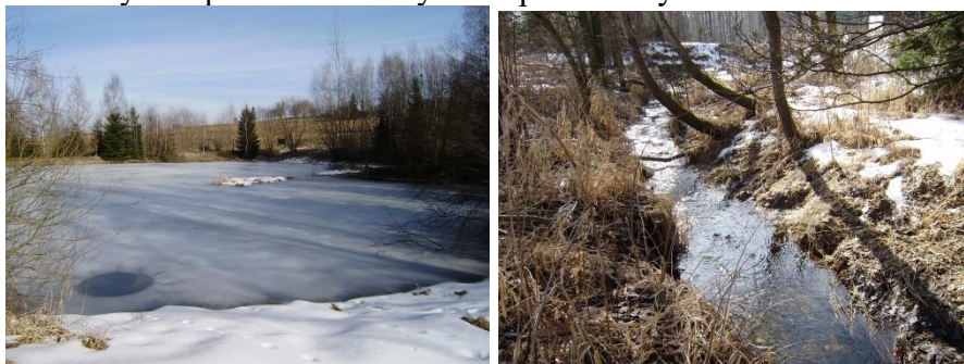
Přírodní čistička pod Jankovem a pokračování Jankovského potoka pod čističkou (2021)

Prameniště Jankovského potoka se nachází mezi olšinami na pomezí osady Chaloupky (patřící k Novému Rychnovu) a pod samotou U Matějků (v katastru Vyskytné), ale po několika desítkách metrů už potůček meandrující mezi mokřadními lukami vstupuje do katastru obce Jankov. Kdysi v minulosti tvořil přirozenou hranici mezi panstvím pražského arcibiskupství se sídlem v Červené Řečici a panstvím kláštera Želivského. Jankov byl jednou z nejvýchodnějších enkláv želivského panství a sousední ves Vyskytná už patřila arcibiskupství. Pro katastry obou vsí je Jankovský potok dosud hraničním potokem. Cestou sbírá pramínky, stružky a potůčky z přilehlých svažitých míst a společně s Hejlovkou se vlévá do Sedlické přehrady u Želiva, to už je z něho docela mohutný tok, který po opuštění přehrady nese nové jméno – Želivka. Dál tok řeky pokračuje až k soutoku se Sázavou, ta se pak vlévá do Vltavy a nakonec její vody donese Labe až do Severního moře. Vodní nádrž Švihov na Želivce se stala zásobárnou vody pro Prahu, a proto byly i v katastru Jankova vybudovány dvě přírodní čističky na odpadní vody.