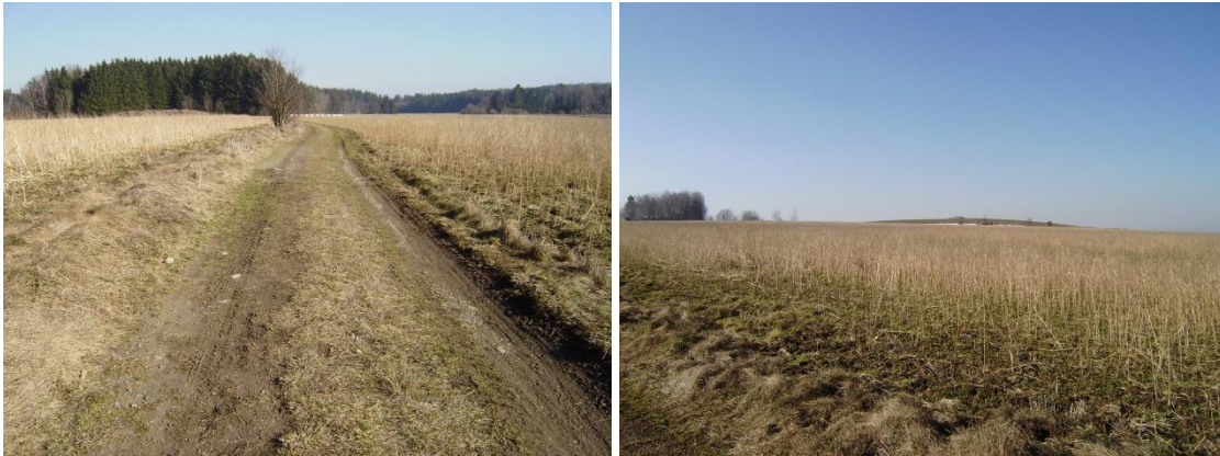
Cesta od křížku dolů k lesu a pohled zpátky od lesa na vykukující vrchol „Ševcův kopec“, kde se opravu můžeme projít po „střeše Evropy“ (2021)

Když vystoupáme obcí některou z cest ke „Kalcovému křížku“ a ke „skále“ (bývalému lomu), otevře se před námi terén mírně se svažující k východu. A pak cestou dolů k lesu se dostaneme do luk, kdysi nazývaných „Jankovsko“, z nichž vytékají drobné stružky a potůčky, které se v lesních úsecích stékají a pod samotou Váchovnou se vlévají do potoka vytékajícího z „Panských lesů“. Po splynutí s Jedlovským potokem vody putují do řeky Jihlavy, pak do Dyje a Moravy a nakonec po dlouhé cestě Dunajem vyústí do Černého moře.