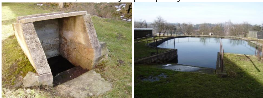
Obecní studna a pohled přes rybník pod studnou do údolí Jankovského potoka (2021)

Ves byla založena na mírném svahu, svažujícím se k západu a chalupy byly postaveny po obou stranách silnice, na horní a dolní straně. Uprostřed dolní strany vyvěrá silný pramen vody, nad kterým naši předkové postavili obecní studnu, ke které dříve všichni chodili pro vodu. Odtud voda potrubím pokračuje do obecního rybníka a dál teče svažitém terénem až do Jankovského potoka. Kdysi dávno mocný proud vody vymlel ve svažitém terénu směrem k potoku hlubší údolí, které se nyní postupně vyrovnává.